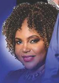
DR PEARL KUPE SOUTH AFRICA