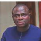
TUO ADAMA COTE D'IVOIRE